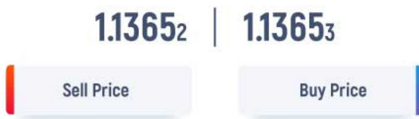
Slika 1. Prodajna (Sell) cena in nakupna (Buy) cena

Na sliki št. 1 je dana sell in buy cena valutnega para EUR/USD. Vprašanje je kolikšen je spread?